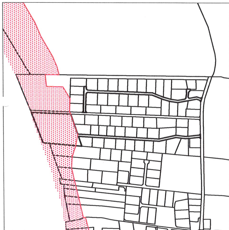
Matrikelkort, Gengivet i henhold til tilladelse G 013/1998