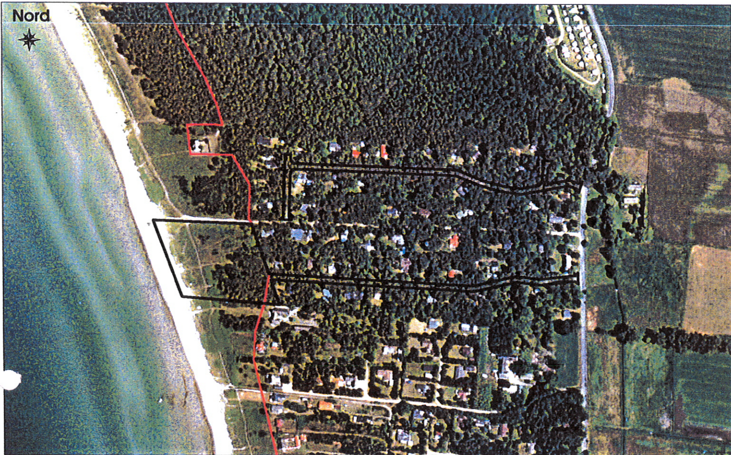
Luftfoto optaget juni 1995, Copyright Kampsax Geoplan